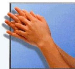
2. Handfläche auf Handfläche mit verschränkten, gespreizten Fingern