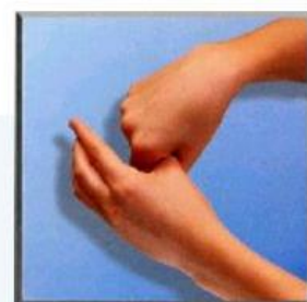
3. kreisendes Reiben des rechten Daumens in der geschlossenen linken Handfläche und umgekehrt