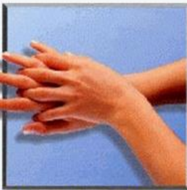
4. rechte Handfläche über linkem Handrücken und linke Handfläche über rechtem Handrücken