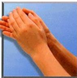
1. Handfläche auf Handfläche